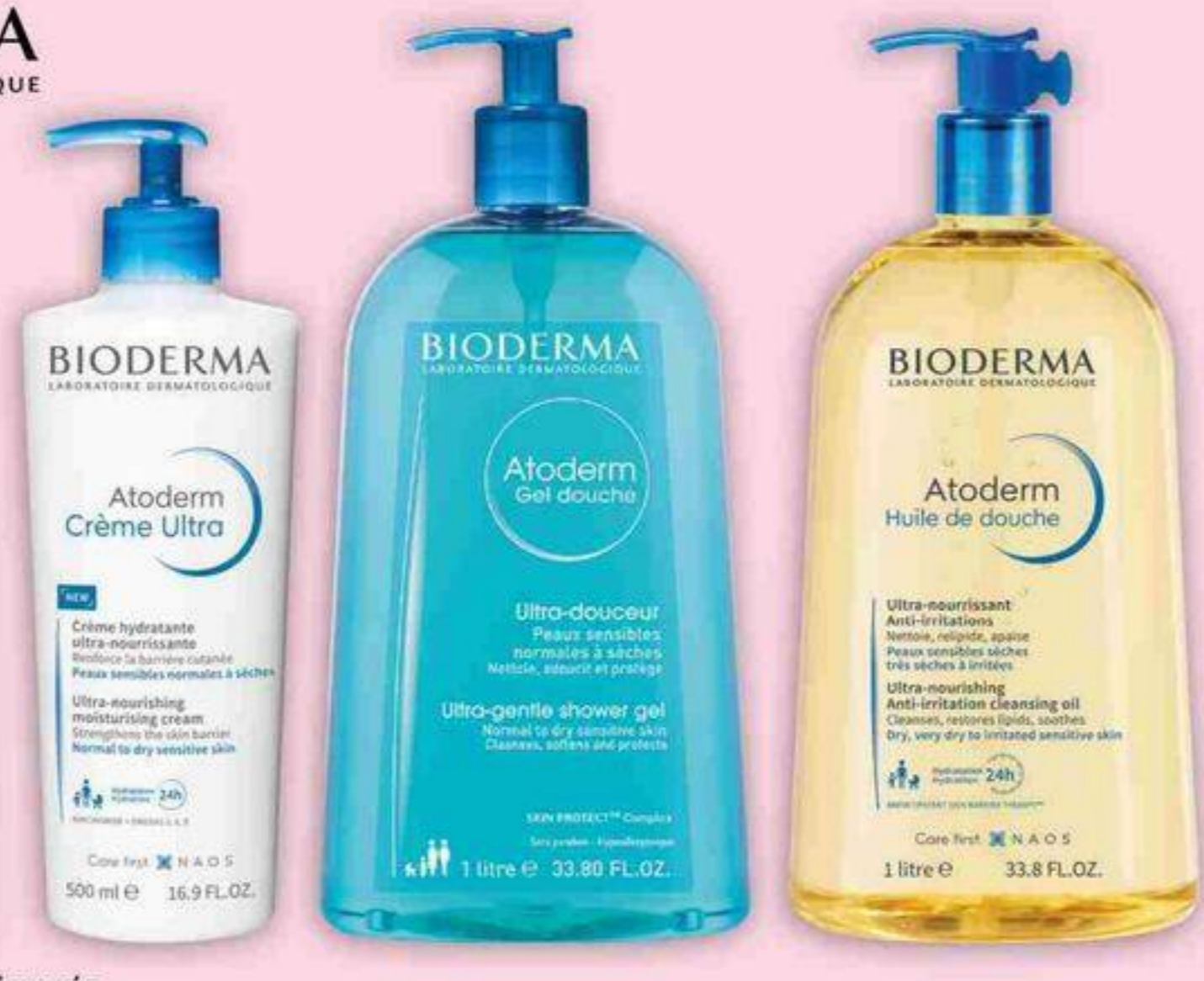
Produits sélectionnés Selected products