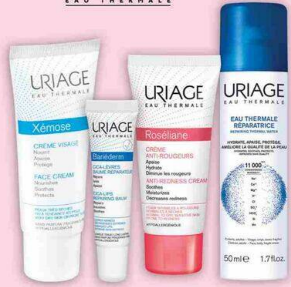
Gamme complète Line drive