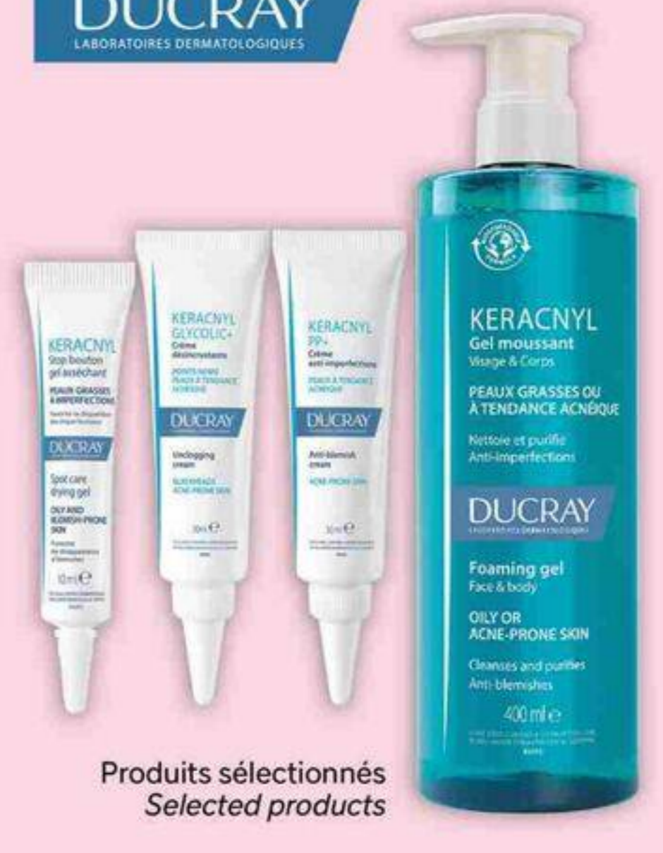
Produits sélectionnés Selected products