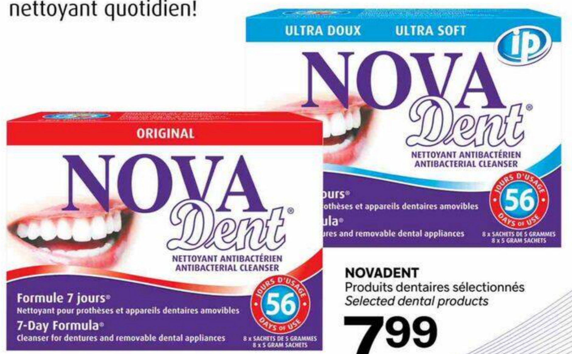
NOVADENT Produits dentaires sélectionnés Selected dental products

Novadent Formule 7 Jours MC simplifie l'entretien de votre appareil dentaire amovible. Un sachet procure une solution nettoyante qui reste active durant toute une semaine. La solution nettoyante est toujours prête au moment où vous en avez besoin. Finis les tracas à préparer un nettoyant quotidien!