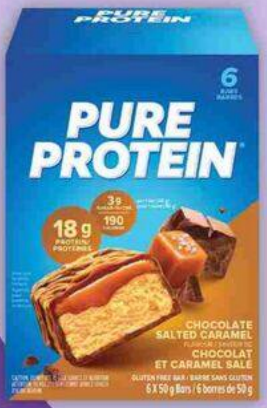
PURE PROTEIN, NUTRIBAR, GENUINE HEALTH Produits sélectionnés Selected products