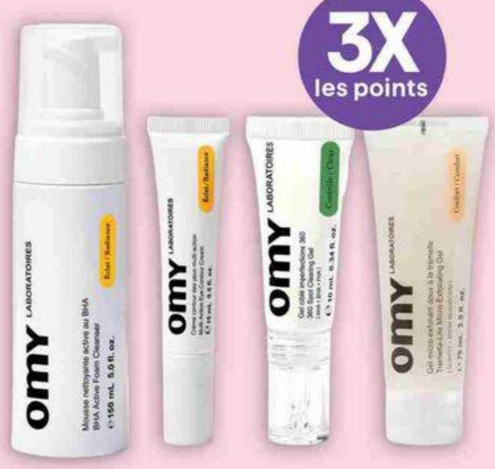
Gamme complète Line drive