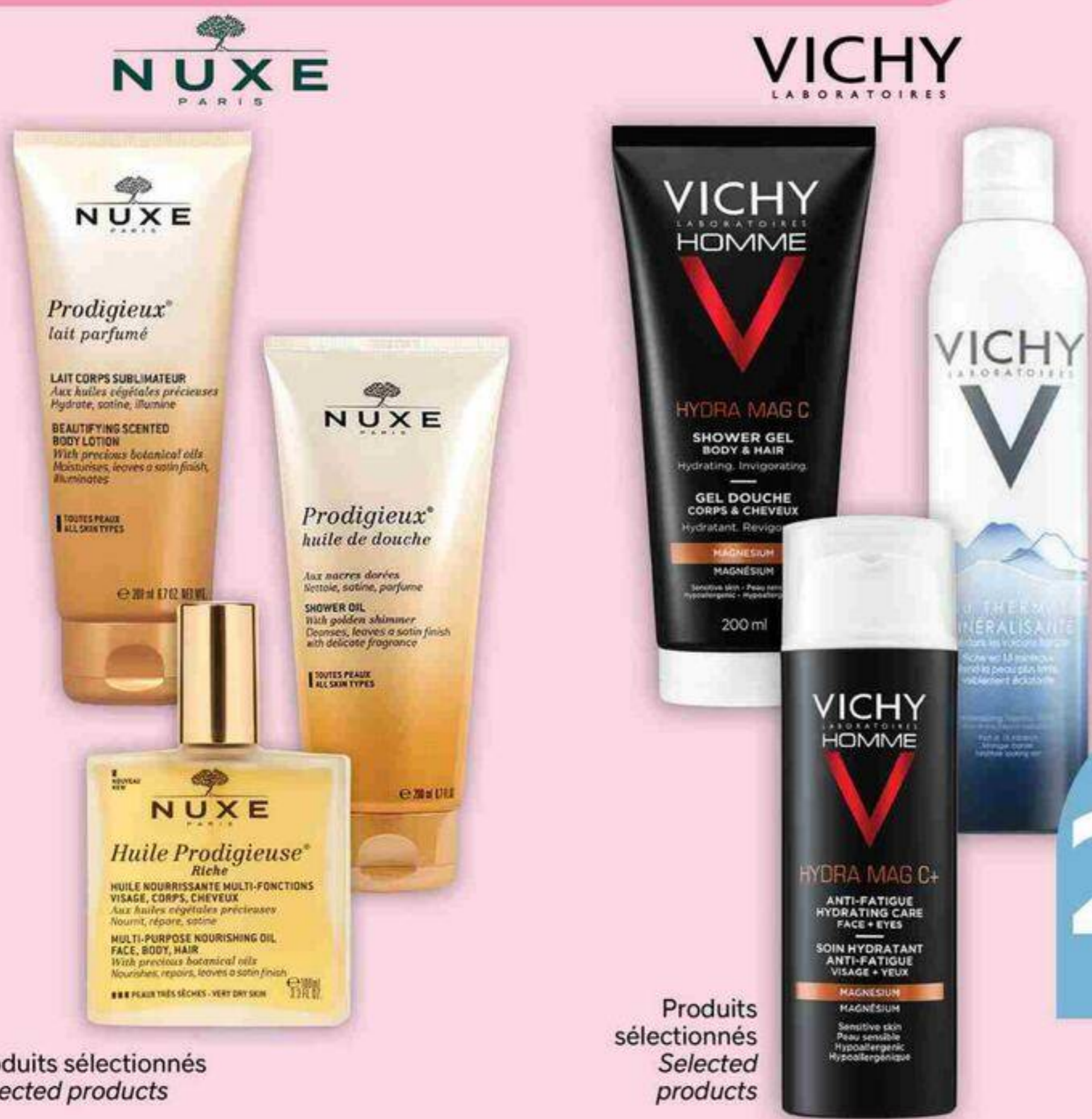
Produits sélectionnés Selected products